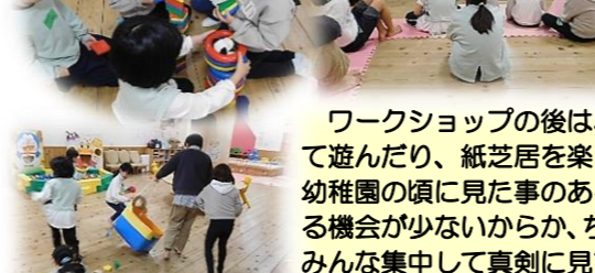
ワークショップの後は、みんなで体を動かして遊んだり、紙芝居を楽しんだりしています。幼稚園の頃に見た事のある紙芝居も、最近は見ることが少ないからか、ちょっと難しいお話もみんな集中して真剣に見てくれていますよ。