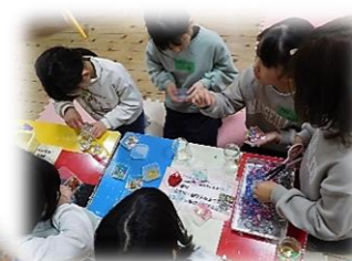
スノードームを作ろう！

円形の土台に糸を渡す作業が、だんだん複雑になっていく中、お友だちと協力しながら頑張って作りました！みんなどんな願い事をするのかな？