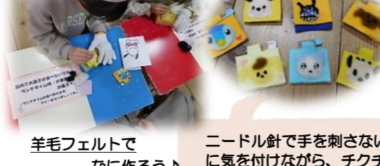
羊毛フェルトでなにを作ろう！

好きなパーツを容器に入れて、魔法のお水を注ぐと…キラキラと輝きながらゆっくりと舞う様子はとてもきれいでした☆