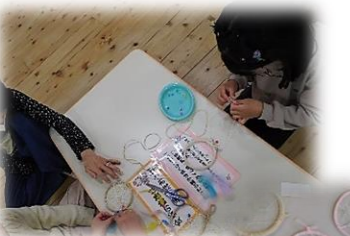
ドリームキャッチャーを作ろう！

きらりっこでは地域の小学生の居場所づくりの一つとして‘☆あつまれ！小学生☆～きらりっこであそぼうよ！！～’を開催しています。令和5年度は月に一度土曜日の午後から開催し、地域の小学生が広場に来て楽しく遊び、様々なワークショップに参加して、みんなで色々作ったり体験したりして楽しみました♪