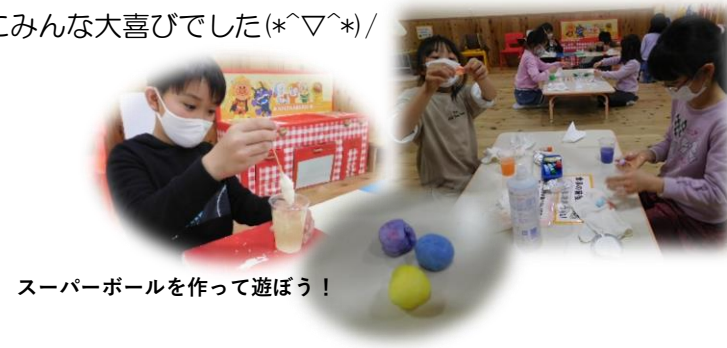
スーパーボールを作って遊ぼう！

R3年度は9月から‘広場開放(自由遊び)’を行う予定です。またチラシやポスター、ホームページなどでお知らせしますのでご覧ください♪