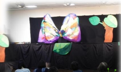
『はらぺこあおむし』