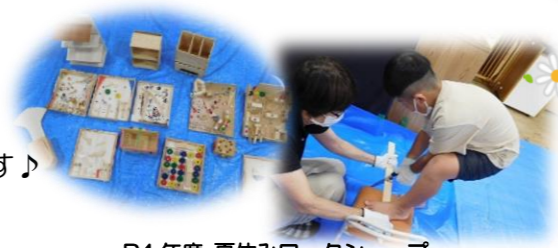
R4年度 夏休みワークショップ 『木材を使って自由に作ろう!』

今年度も小学生向け夏休みワークショップ、秋からは月1回ワークショップを開催予定です。詳細は決定次第ホームページやブログでお知らせしますので、チェックしてみてください。