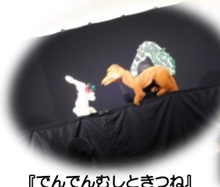
『でんでんむしときつね』